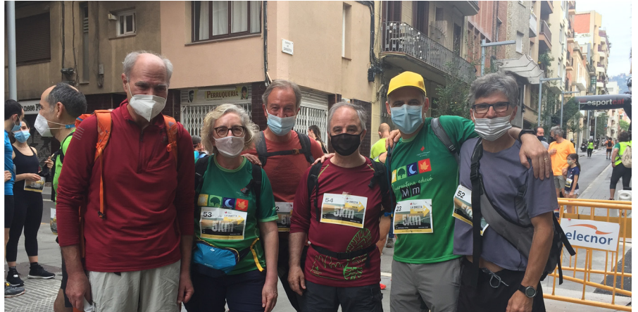
Esperant la sortida.