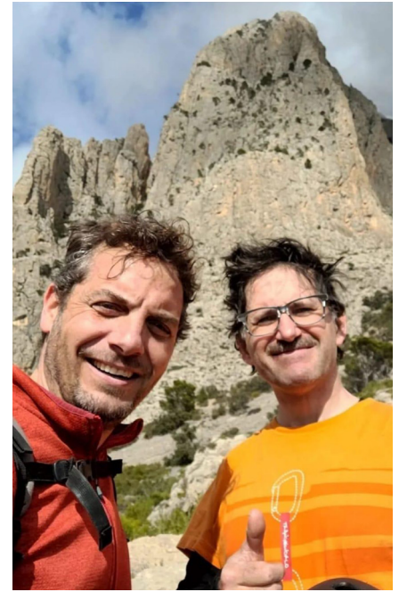
El Puig Campana al fons

Després continuem fent els llargs intentant allargar les cordades perquè podem fer reunions amb friends, arbres o parabolts d'una forma segura. Un parell de cops, veiem que el fet d'haver allargat més distància de la marcada, és contraproductiu perquè la corda tiba, però, per una altra banda, podem començar la següent cordada d'una forma més segura, ja que intentem acabar just abans dels passos més verticals i exigents.