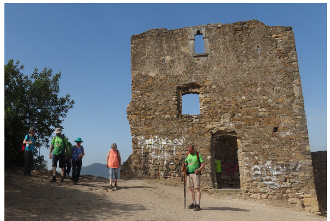
Castellciuró, antiga fortalesa

La Junta es va constituir el 25 de maig del 2021