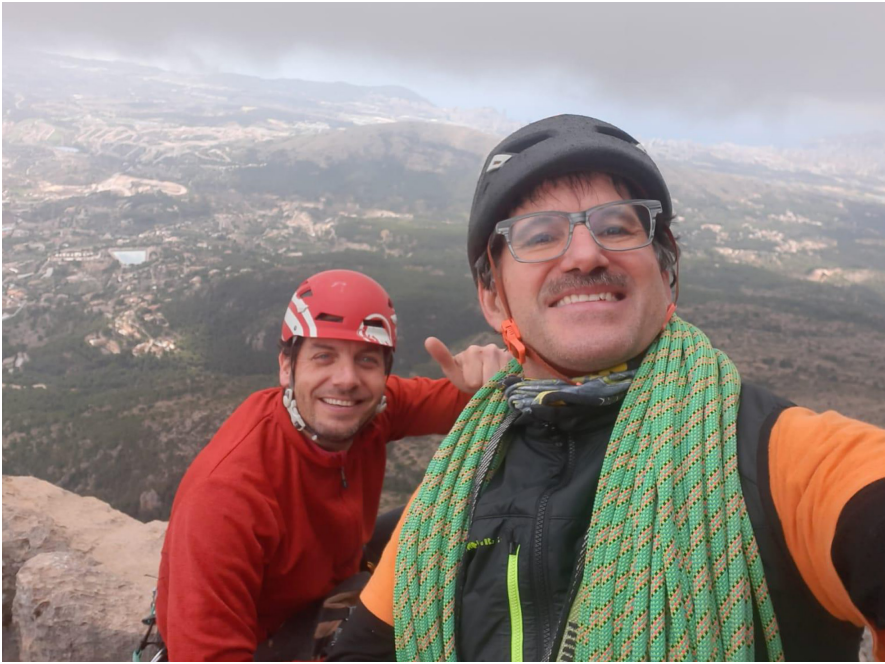
Dalt del cim