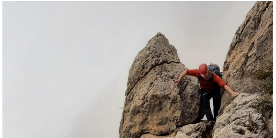
Part de l'escalada