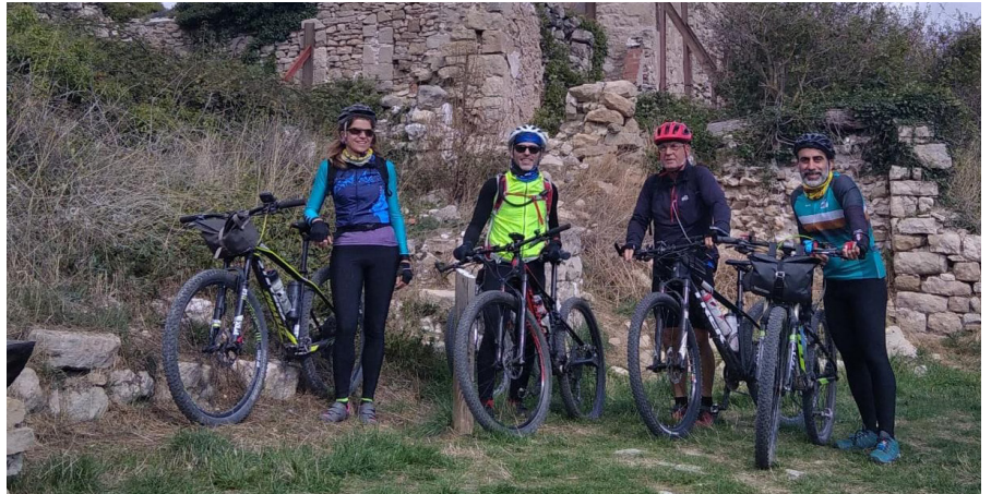
La Mussara.