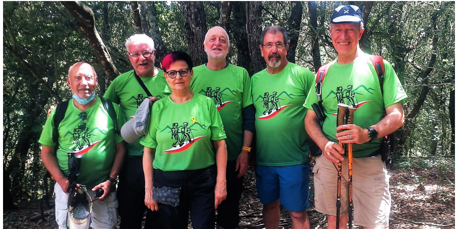
Junta de Senders