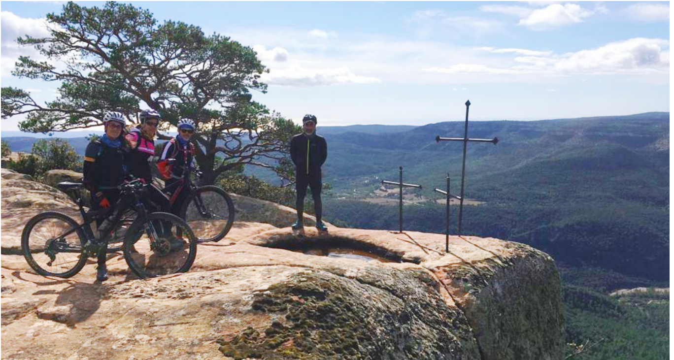
Mola dels Quatre Termes.