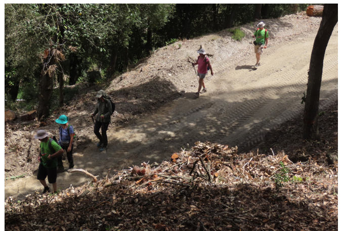
Baixant el Turó de Castellví