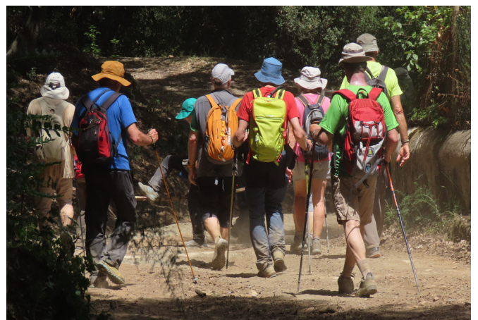
Arribant al baixador de Vallvidrera