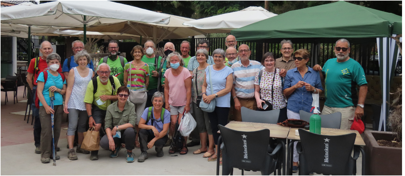
Davant del restaurant

En aquesta sortida final del curs, hem apreciat com poques vegades les breus aturades a l'ombra de les arbrades, l'aigua relativament fresca de les cantimplores i els bons moments de conversa amb les companyes i els companys. Hem aprofitat els trams en què el camí s'eixampla per xerrar uns al costat dels altres. Hem aprofundit en temes d'actualitat que anaven des del futur poblament del planeta Mart, a les raons de la lluita feminista o les preferències culinàries per la tripa a la brasa.