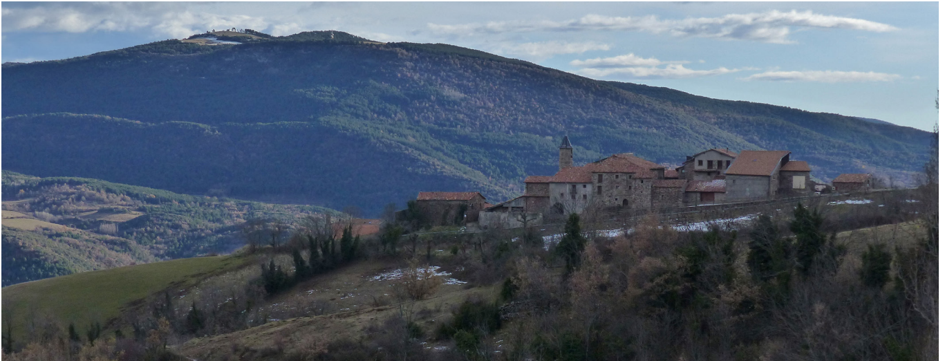
Visitant els poblets de la vall