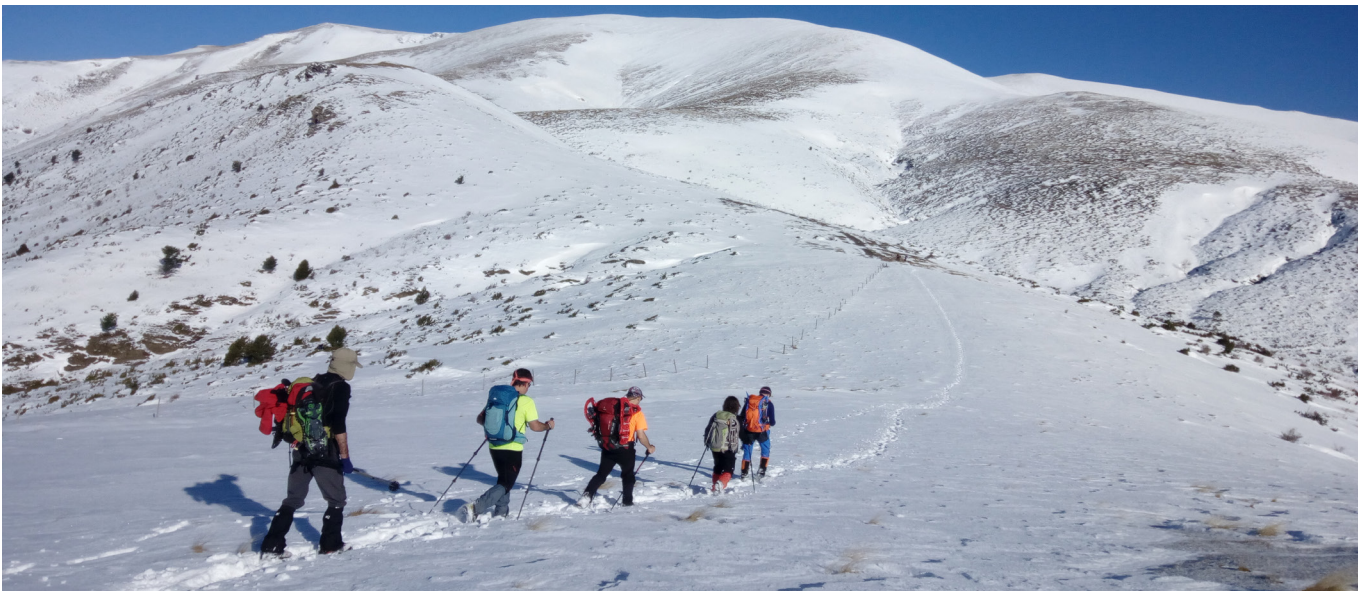
Cap el Tuc de la Cometa