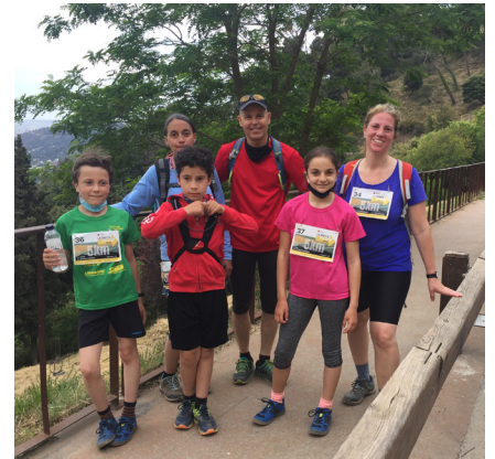
Acabada la cursa.

Després de diverses proves i temptatives, permisos i entrebancs, el diumenge 30 de maig es posava en marxa l'Edició Zero de la Directa al Tibidabo. Es tractava de fer la pujada des de Vil·la Urània (prop del Club) fins la plaça del Tibidabo. Com rere fons teníem la Pandèmia i totes les limitacions que ens havia imposat. Però del que es tractava era de recórrer els prop de cinc quilòmetres que separaven els dos punts indicats, corrent, marxant, caminant,...i així ho van fer els 122 participants que van finalitzar la cursa al costat del Temple Expiatori. El resultat de la cursa ha estat prou positiu i a servit com assaig general per la propera edició. També des d'aquest escrit donar les gràcies a totes les persones voluntàries i autoritats municipals que han fet possible aquest acte esportiu.