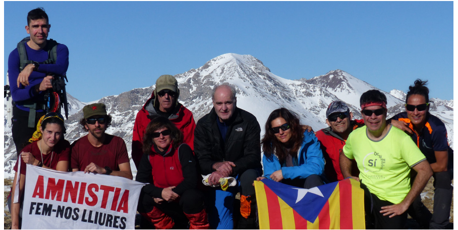
Dalt del Tuc 2.446 m