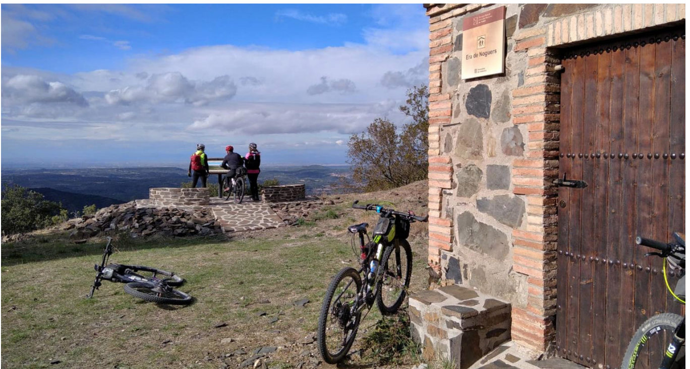
Era de Noguers.

pedregoses i corriols poc pedalables fins que guanyem prou altura. Finalment, seguim per la solitària carretera fins el Coll de la Mussara, des d'on visitem el Refugi i el poble abandonat. Reprenem pista passant per sobre dels avencs de la Febró fins arribar al poble, on per decisió