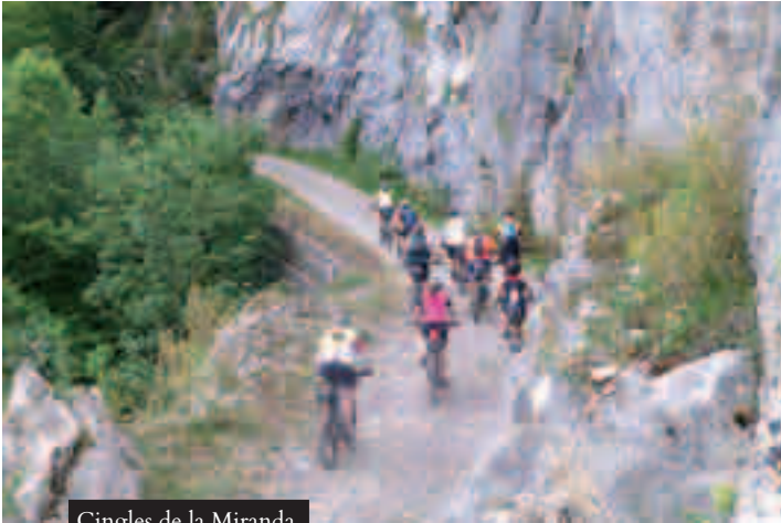
Cingles de la Miranda, entre Camprodon i Oix