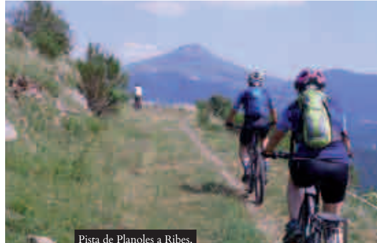
Pista de Planoles a Ribes, el Taga al fons

El recorregut es un pedregam constant fins el coll de la Pera, on s'enllaça amb la carretera d'Oix a Beget., en aquest tram tenim un accident que deixa una lesió al peu d'una de les participants, arribem a baixar amb certa dificultat fins a Oix. Si seguim per la carretera és tot baixada fins a Oix, el recorregut original va per la pista de Sant Miquel de La Pera, força dret amb algun tram encimentat, però majoritàriament pedregós. A Oix ens allotgem al càmping La Soleia d'Oix.