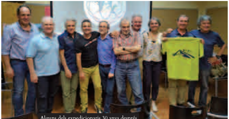
Alguns dels expedicionaris 30 anys després