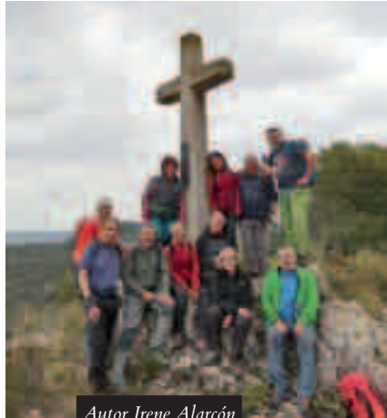
Autor Irene Alarcón