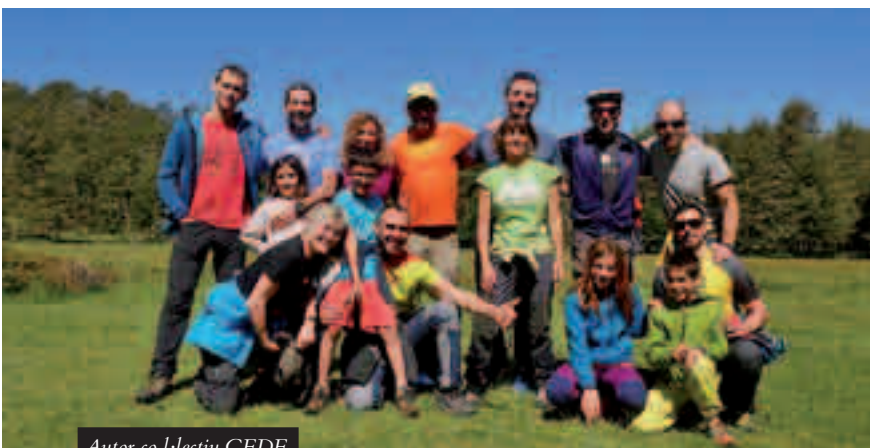
Autor col·lectiu GEDE.