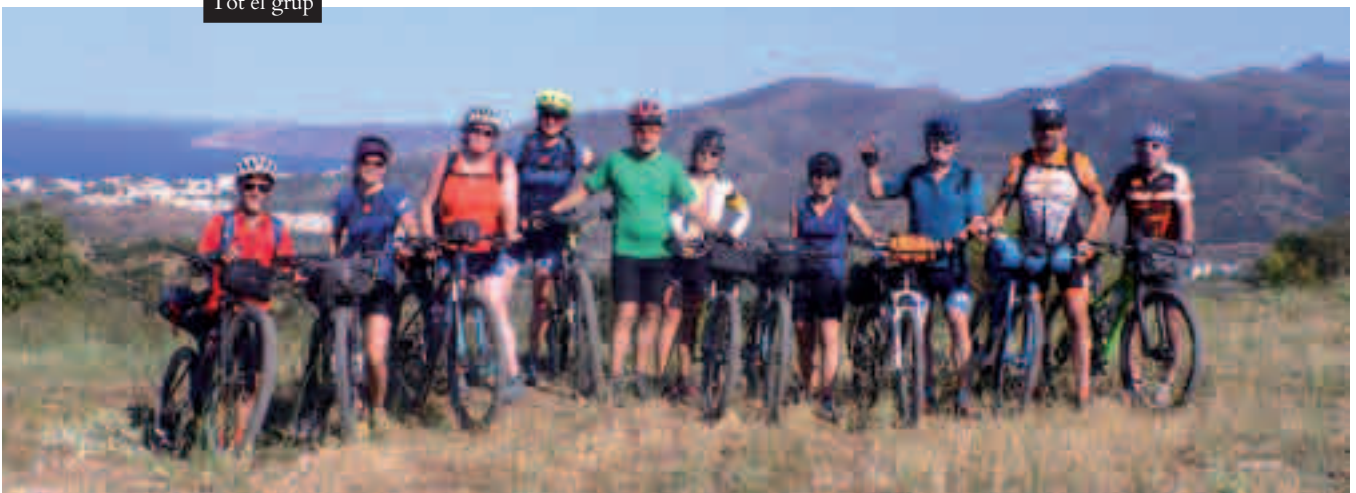
Tot el grup

La calor i la deshidratació apreten, combinem carreteres locals i pistes fins a Espolla des d'on seguim el GR-11 fins el coll de la Serra, una primera baixada i posterior remuntada fins el coll de les Portes, des d'on ja fem el darrer descens fins a Llançà, la platja ens espera.