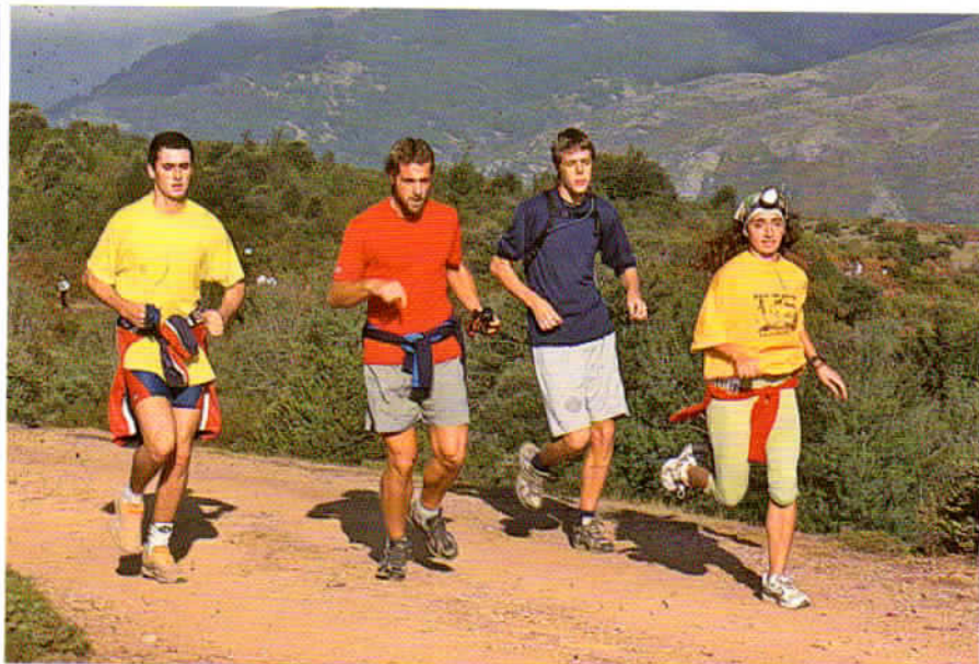
Pla de la Calma. El Servei de Parcs Naturals ha anat desviant l'itinerari cap a pistes i camins amples.

Bauma —on soparen frugalment i s'acomiadaren del guia que els havia acompanyat des de Sant Llorenç Savall.